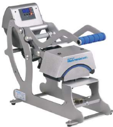
סטאלס מגנטי ארה"ב - כובעים, ידני