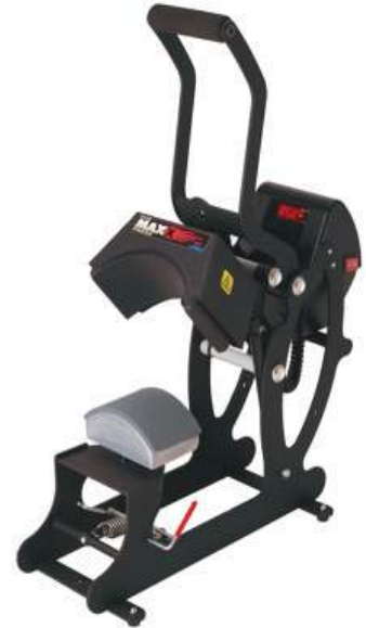
סטאלס MAXX שחור ארה"ב - כובעים, ידני