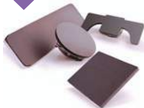
בסיסיים מתחלפים המתאימים לנעליים, שרוולים וכו'