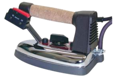
L1 / L5 / M5