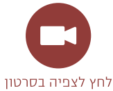
לחץ לצפייה בסרטון