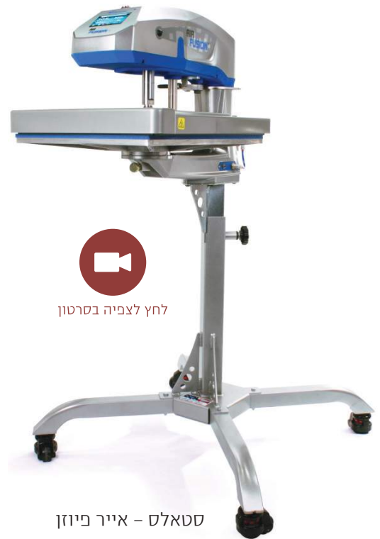
לחץ לצפייה בסרטון

דגמי פיוזן - בסיסיים מתחלפים המתאימים לנעליים, שרוולים וכו'