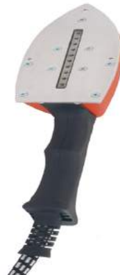
ידית ספיד לגיהוץ אנכי