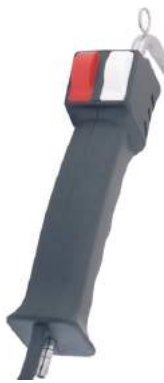
אקדח קיטור להסרת כתמים