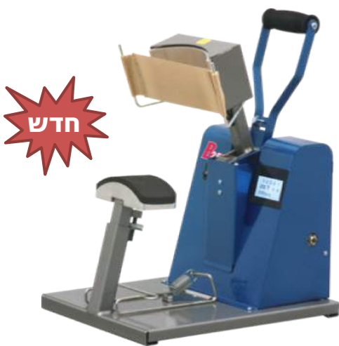
הוא ארה"ב - כובעים, ידני

« לחץ עקבי הניתן להתאמה אישית » זרוע מוגבהת לשיפור הלחץ « מתקן המותח את הכובע « מתאים להדפסה על כל עובי של כובע » אחריות לשנה