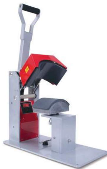
סטאלס סין אדום - כובעים, ידני