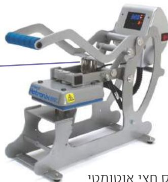
סטאלס חצי אוטומטי