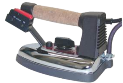
L1 / L5 / M5