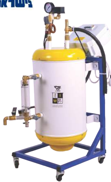
דוד "וולף" 15 ליטר