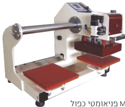
MCM פניאומטי כפול