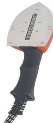
ידית ספידית לגיהוץ אנכי