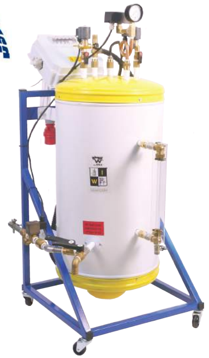
דוד "וולף" 40 ליטר