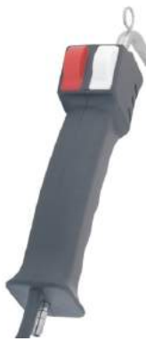
אקדח קיטור להסרת כתמים