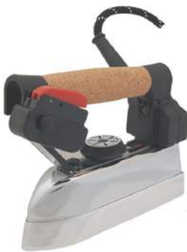
מגהץ צר לכובעים / פתיחת תפרים