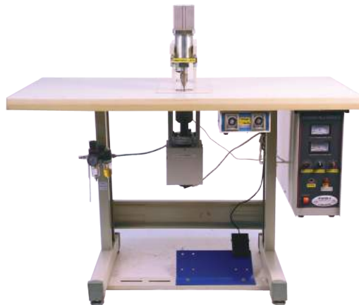
הלחמה נקודתית | YON 50