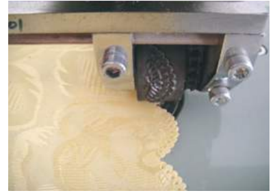
הלחמה / חיתוך מתמשך | YON 15